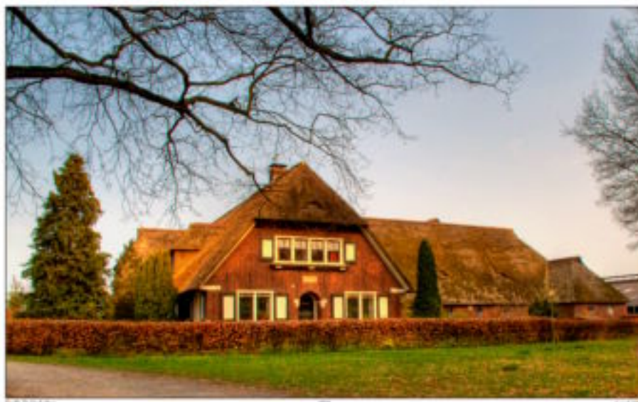
De Oude Mars in Zwolle Zuid