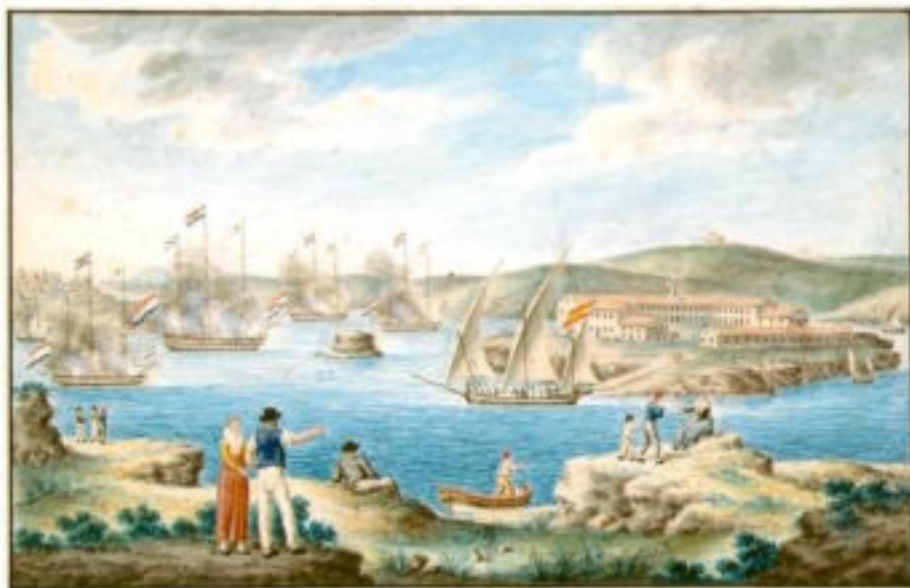
De Nederlandse vloot in de haven van Mahon (Minorca)

Tegen de avond nam de wind af, "hetwelk ons noodzaakte om in de Noordzee te ankeren, daar wij door de stroom, die ons tegen was, teveel verloren. Het